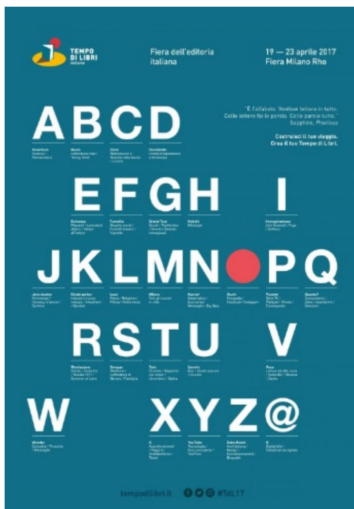
La griglia dell'alfabeto Tempo di Libri