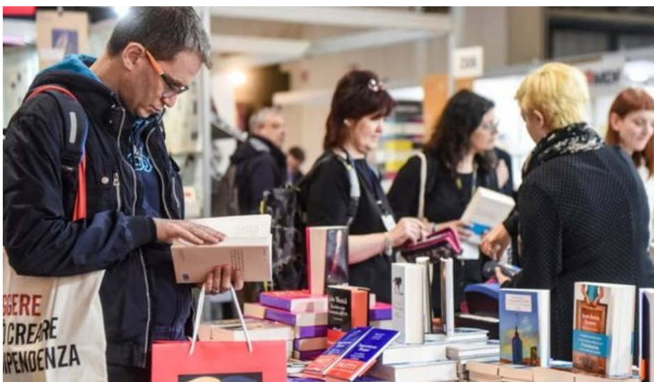
Tempo di Libri lascia Rho Fiera

Ultimo aggiornamento: 29 giugno 2017 ore 07:15