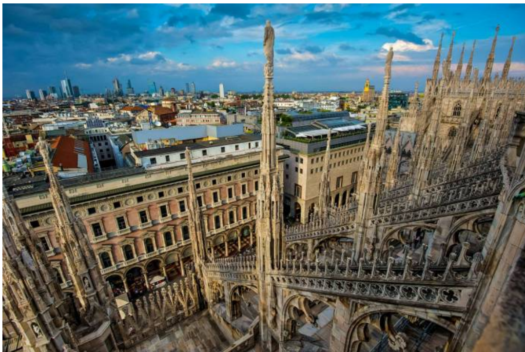
Il panorama di Milano dalle guglie del Duomo

Ad attirare sempre più turisti (la Camera di Commercio ne ha contati 3 milioni nei primi 6 mesi del 2017 ) è stato anche il modello delle cosiddette “week” . Milano infatti non è “solo” moda e design, ma ha nelle sue corde una profonda propensione alla cultura e all’innovazione . Su queste due leve l’amministrazione comunale si è ispirata al “combo” vincente Salone + Fuorisalone, replicandolo in altre aree tematiche. Sono nate così MiArt, Radiocity, Bookcity, PianoCity... Ai milanesi le proposte piacciono, ai turisti anche di più. A traino anche il boom della ristorazione , che tra il 2008 e il 2016 ha visto crescere il numero degli esercizi del 46,8% ( fonte Sole24ore ).