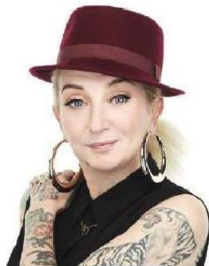
PINA di Radio DeeJay