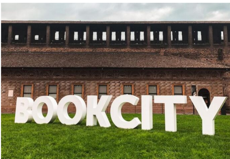
Bookcity: organizzatori, straordinaria affluenza di pubblico.