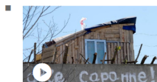
No Tav, la protesta in Val Susa contro la costruzione del nu...