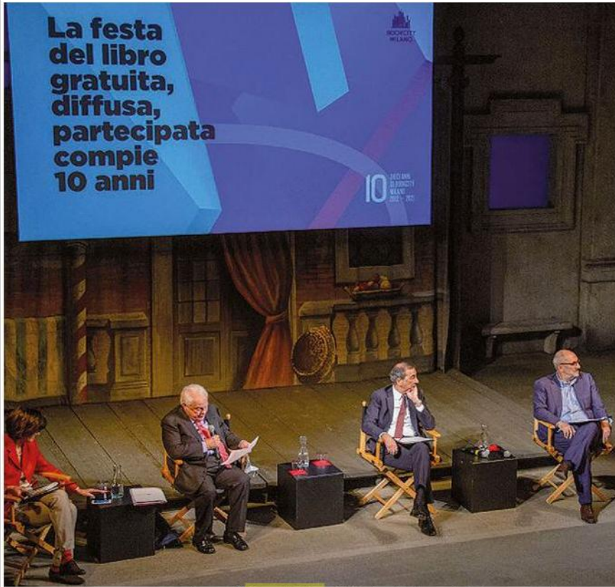
La presentazione di BookCity 2021 al Piccolo Teatro

Gli utenti connessi all'edizione 2020, svoltasi interamente in digitale, dall'11 al 15 novembre