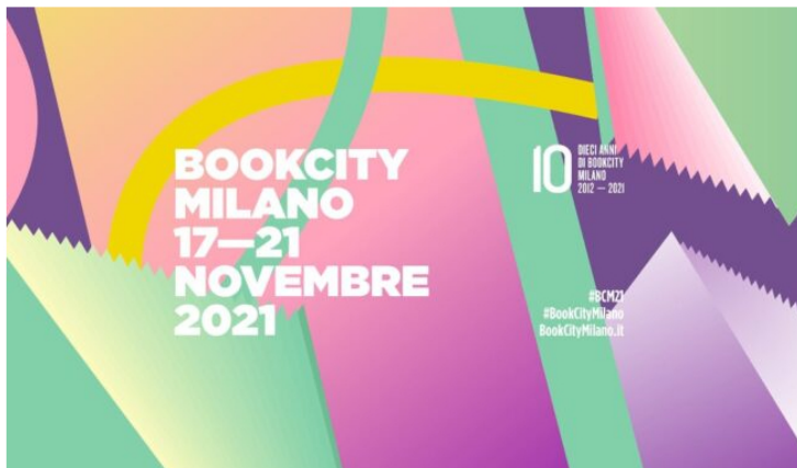
La locandina della decima edizione

Reduce dalla pandemia e dagli incontri online, BookCity torna davvero a Milano, nelle librerie, nei teatri e negli auditorium, nelle università e nelle biblioteche, torna in presenza per guardare al futuro, scegliendo come tema portante la parola Dopo .